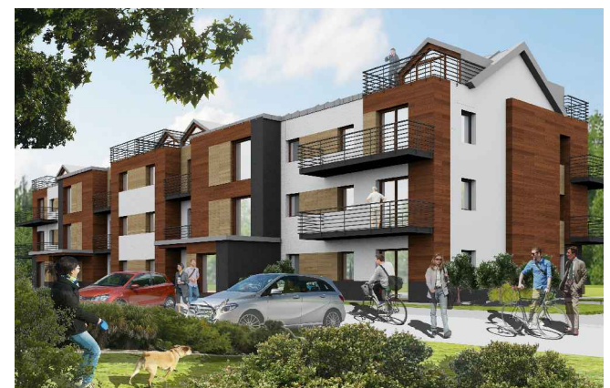
budynek wielorodzinny przy ul. Smętnej w Krakowie mieszkanie nr 6, 3-pokojowe, powierzchnia 70,26m 2